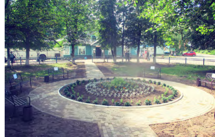
«Площадь двух вокзалов». Как стало