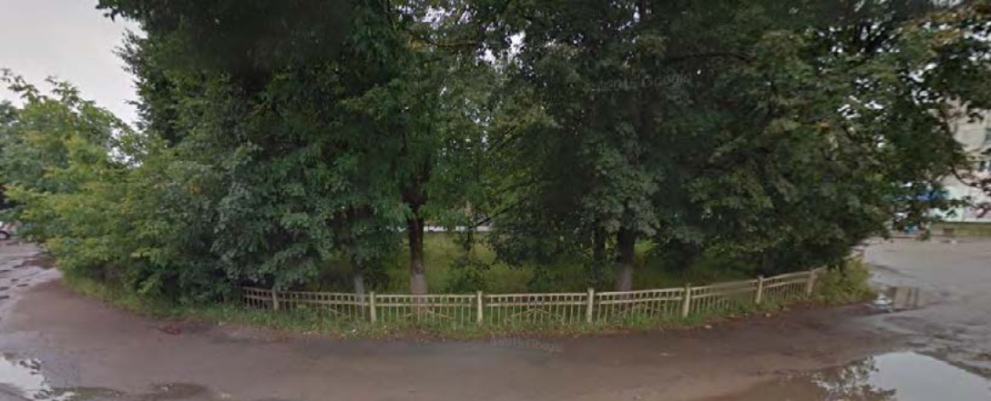
«Площадь двух вокзалов». Что было