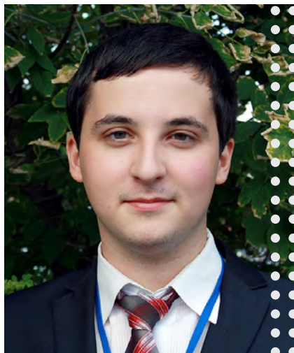
Рассказывает создатель проекта Артем Кобляков

Фотоконкурс, фотовыставки и образовательно-познавательная программа, направленные на привлечение внимания молодежи к проблеме сохранения историко-культурного наследия