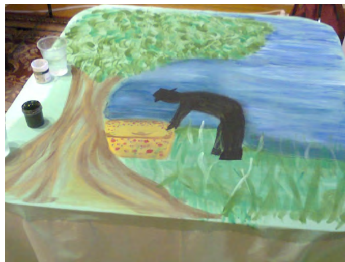
Рисунок на полотне ширмы. Роспись полотна: композиция и фон разработаны и воплощены в согласии с креативными идеями подрастающих декораторов.

Эскиз ширмы. Черно-белый, подготовленный главными действующими лицами — детьми совместно с художниками-добровольцами проекта.